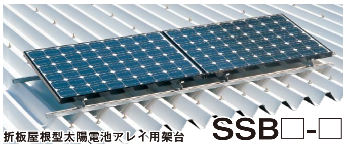
折板屋根型太陽電池アレイ用架台